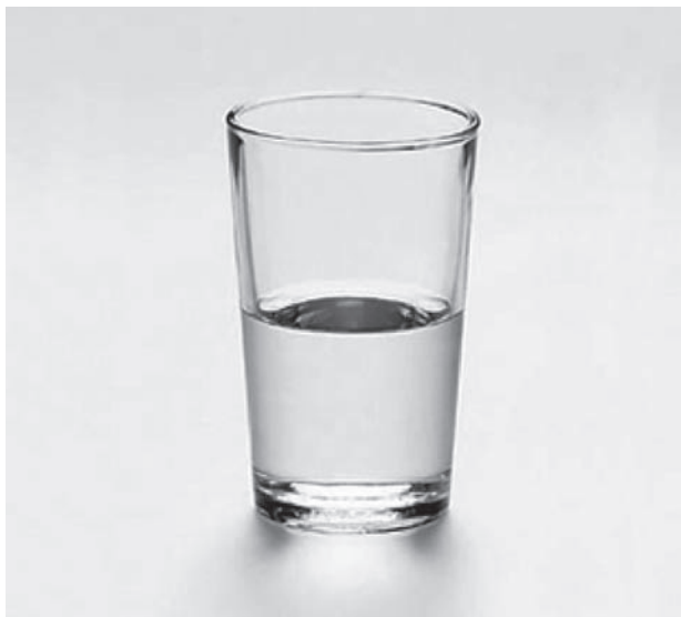
Abb. 1: Wasserglas

Das Beispiel ist allgemein bekannt, doch seine Bedeutung wird leicht unterschätzt: Ein Wasserglas steht auf dem Tisch, und jemand sagt: „Das Glas ist halb voll.“ Jemand anderes sagt: „Das Glas ist halb leer.“ Ein und dasselbe (phänomenologische) Wahrnehmungsphänomen, ein und dieselbe Situation und (mindestens) zwei sehr unterschiedliche (konstruktivistische) Wahrnehmungen und Perspektiven. Wie kann das sein? Was dabei deutlich wird, ist etwas sehr Grundlegendes, was erst im Zuge der Postmoderne in seiner ganzen Tragweite ans Licht gekommen ist: Es gibt nicht die Wirklichkeit, die von allen gleich wahrgenommen und erkannt und gewissermaßen nur gespiegelt und reflektiert wird (das Reflexionsparadigma), sondern der Akt