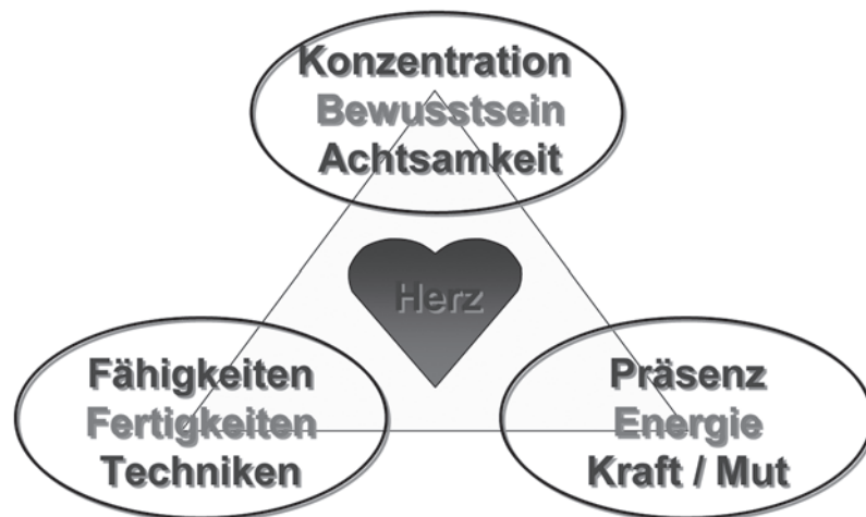
Abb. 2: Dreieck der Professionalität