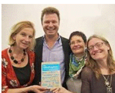
Das Autorenteam auf der BUCH WIEN

Sigmund Freud Museum - Buchleseeerlebnisabend mit Aufstellung (Essenz, ca. 12 Minuten), 22.10.2012: http://youtu.be/q_TuH-v-z94