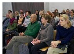
Lesung im Freud Museum