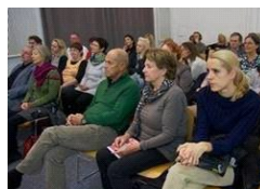
Lesung im Freud Museum