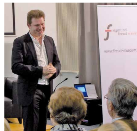
Buchpräsentation, Freud-Museum Berggasse

Michael wiederholt nun persönlich die Rituale, die er bei seinem Stellvertreter gesehen hat. Dabei erkennt er die Bedeutung seiner Symptome: Der Bluthochdruck signalisiert ihm, dass er zu viel Verantwortung für andere übernimmt und das Augenzucken hat es ihm ermöglicht klarer zu sehen, worum es geht. Er macht nicht mehr aus Rücksicht auf andere die Augen zu, sondern setzt klarere Grenzen, wenn ihm etwas zu viel wird. Das Gefühl der Wut, das er jetzt deutlicher wahrnehmen kann, weist ihn darauf hin, dass etwas gegen seinen Willen läuft und gibt ihm zugleich die Kraft zur Abgrenzung. Der Stellvertreter des Bluthochdrucks sagt: „Jetzt kann ich mich zurückziehen. Doch wenn Du nicht auf Dich selbst achtest, komme ich wieder, um Dich aufmerksam zu machen.“ Michael erkennt in dem Symptom ein Signal bzw. eine Art inneren Lehrmeister, der ihn auf Veränderungsbedarf aufmerksam macht.