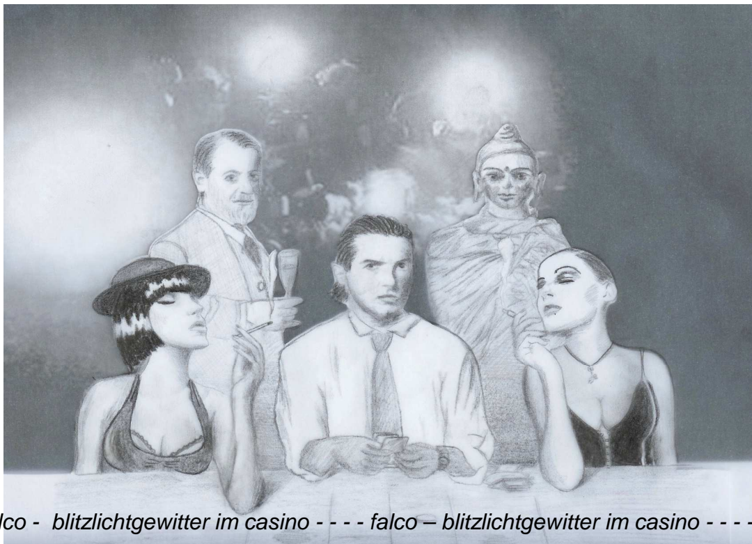
falco - blitzlichtgewitter im casino - - - falco – blitzlichtgewitter im casino - - - falco

1. Akt, Samstag, Wien, Spielcasino - Wir schreiben das Jahr 2009, eine heiße Sommernacht. Blitzlichtgewitter der Fotografen – Tumult - ich mittendrin – wie immer... Show-Biz... Musik im Hintergrund: ... Drum, wenn ich das große Los zieh und es geht nicht alles auf, mach ich in der nächsten Stadt mir doch glatt ein Spielcasino auf... „Geld“ – Geniales Lied – könnte glatt von mir sein... Und wer ist eigentlich die Kleine da hinten, die mir ständig zulächelt... „ Und man kann bekanntlich alles, auch die Liebe, dafür kaufen, doch der beste Weg von allen ist, es einfach zu versaufen...Geld... “ Während ich einen tiefen Schluck aus dem Whiskeyglas nehme, kommt ein Mann herein, ich weiß sofort, wer er ist. Verschlucke mich, muss husten. Was macht der hier – Im Jahr 2009? Populär, auch ein Superstar aus Vienna... Dr. Freud rockt durch den Raum, im Rhythmus zu MEINEM Song... „Geld, Geld, Geld...“. Blickkontakt auf die Ferne - Komme leider nicht durch die Menschenmasse – Statt dessen umgarnen mich die anderen, die mit ihm kamen. Die Gier, der Idealismus, und, wer ist die ältere Dame? Sie wirkt spießig! Da kommt die kleine Süße auf mich zu... Dr. Sigmund F. muss warten... das Girl und ich stoßen an... Der „Nachtflug“ kann beginnen... Spüre neidische Blicke in meinem Rücken. Was regen die sich auf - War doch eh von Anfang an klar - denn ich bin Falco.